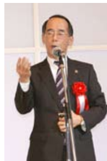
パーティー会場で挨拶する内野海老名市長