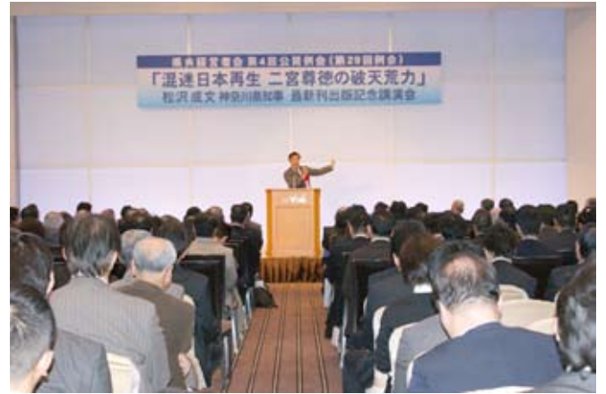
来場数は 400 名以上