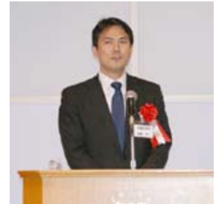
最高顧問に就任した後藤衆議院議員の挨拶