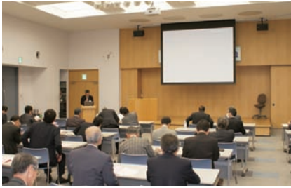
相模川景観づくりプレゼンテーション