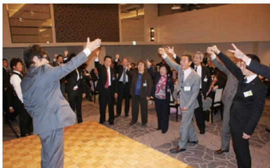
恒例の新春大福引き大会 会長賞