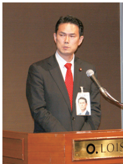
後藤祐一衆議院議員